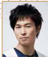
代永翼 「アイドルリッシュセブン」 和泉 三月

ローソンチケット https://l-tike.com/ Lコード【55842】