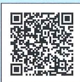
クラルテ HP 公演情報