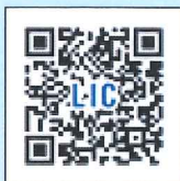
LIC はびきの HP